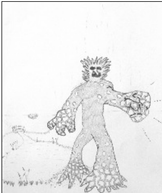
Een impressie van de lavawezens voorkomend in Zonnestein